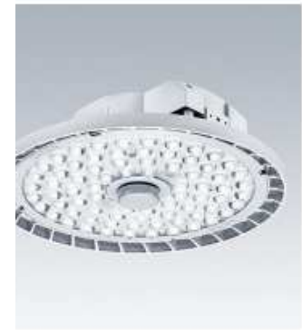
INDU BAY GEN4