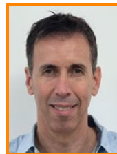
ד"ר עשהאל שריר מנהל אגף החינוך עיריית יבנה